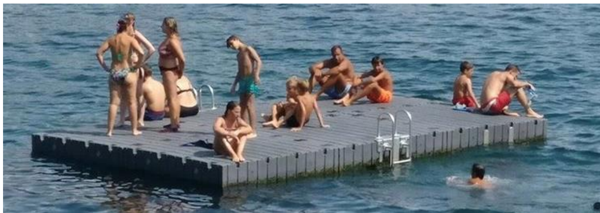
WAP 4 2m x 2m